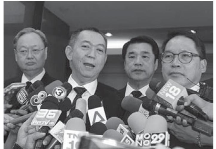
แกนนำ พปชร.ไปเทียบเชิญ ปชป. เข้าร่วมรัฐบาล

ได้วางเว้นจากการเป็นรัฐบาลมานานหลายปี หลังจากพรรคเพื่อไทยชนะการเลือกตั้งมาแบบผูกขาดทุกครั้ง แม้กระทั่งคราวนี้ที่แพ้แบบหมดรูป แต่ด้วยกติกาใหม่ ทำให้ไม่มีพรรคใดได้เสียงข้างมาก จนทำให้เกิดรัฐบาลผสมในรูปแบบดังกล่าว