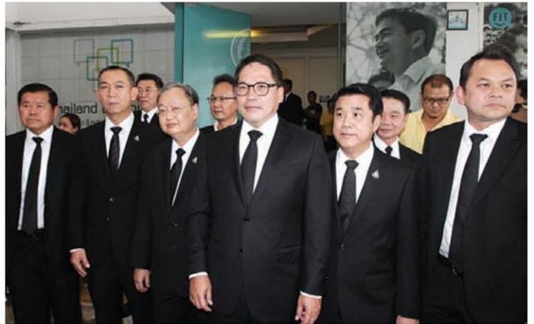
นายอุตตม สาวนายน หัวหน้าพรรคพลังประชารัฐ (พปชร.) พร้อมด้วยแกนนำพรรค เดินทางไปยังที่ทำการพรรคประชาธิปัตย์ และพรรคภูมิใจไทย เพื่อเชิญเข้าร่วมรัฐบาล โดยสนับสนุนพล.อ.ประยุทธ์ จันทร์โอชา เป็นนายกรัฐมนตรี วานนี้ (27 พ.ค.)